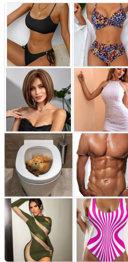
Articoli per Auto Temu

Con Arti e Mestieri Expo - Vento d'Italia, la rotta verso la Cina è dunque assicurata e le PMI del Made in Italy sono abilitate all'export nel mercato cinese.