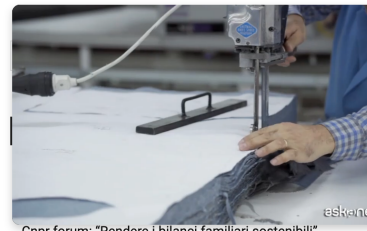
Cnpr forum: "Rendere i bilanci familiari sostenibili"